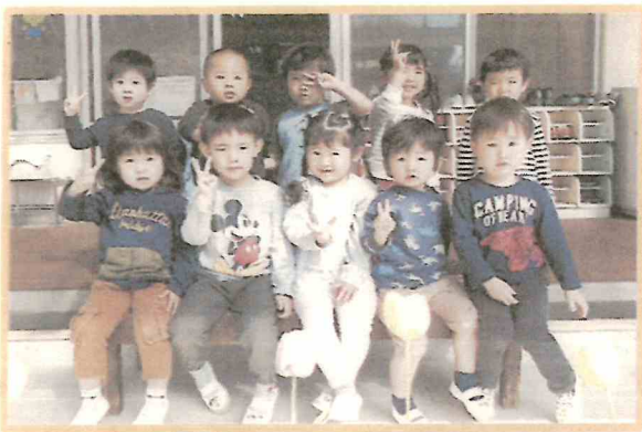
くま組さんになったよ！

園庭のこいのぼりに負けないくらい元気に走り回っています。天候の良い日は、戸外で思いきり遊んで、いろいろな発見や体験ができるようにしたいと思います。