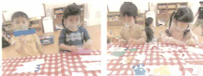
ちぎり絵でこいのぼり作ったよ！