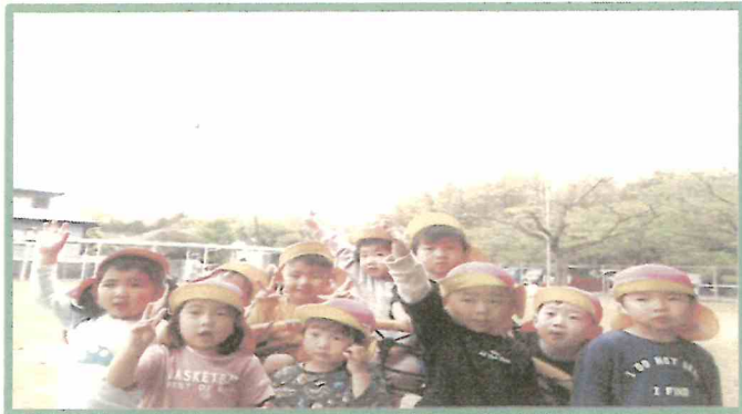
こいのぼりの前でハイポーズ！