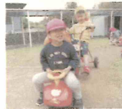
戸外遊び 楽しいね～♪