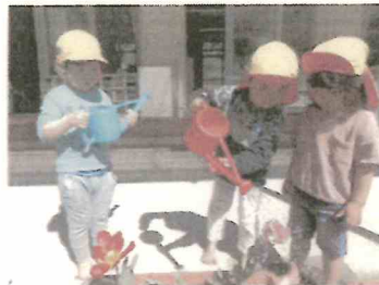
チューリップの水やり