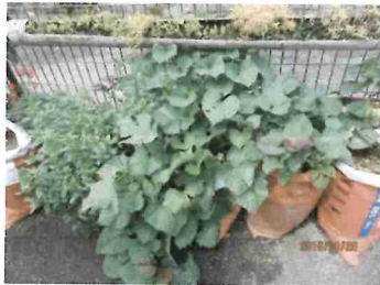
さつまいもは 元気に育っています