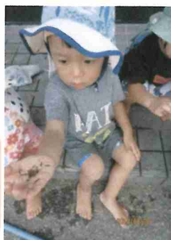
園庭に咲いた草花で 染紙、色水あそびをしました。