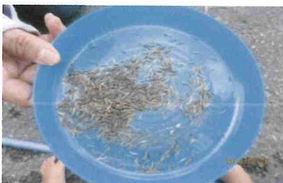
昨年取っておいたコスモス の種を蒔きました。咲くのが 楽しみです。