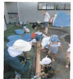
そうめん流しの 竹が砂場の小川 に変身！笹舟や 花びらを流して あそんでいます。