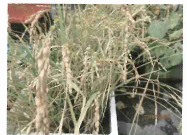
稲刈りをしました。 発泡スチールの畑でしたが 良く実ってくれました。早速 かけて干しました。