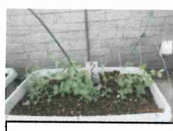
スナッフエンドウ