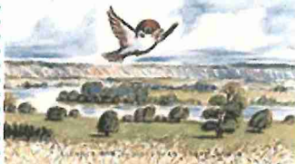
こすずめのぼうけん

『こすずめのぼうけん』 絵本の内容ときれいな絵に引き込まれます。長いお話ですが、絵本の世界に入り込んでみている子ども達です。