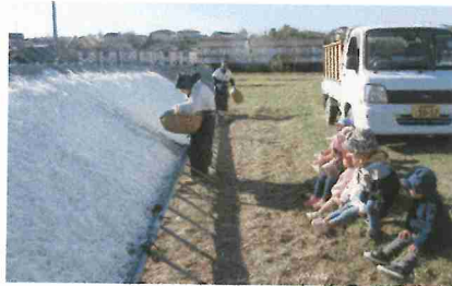
千切り大根をみたよ