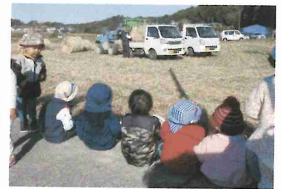
こうして乗せるんだね～