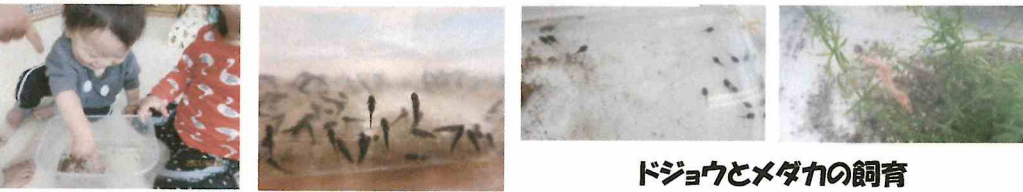
ドジョウとメダカの飼育