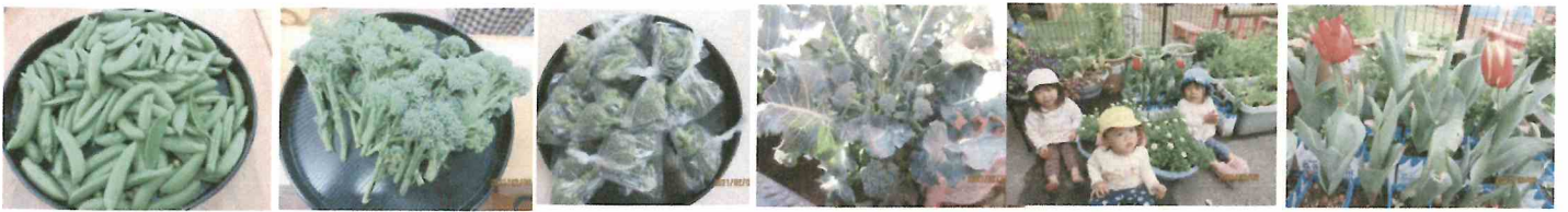
ブロッコリーとスナップエンドウを収穫しました。一人ひとりおうちに持って帰って食べてもらいました。