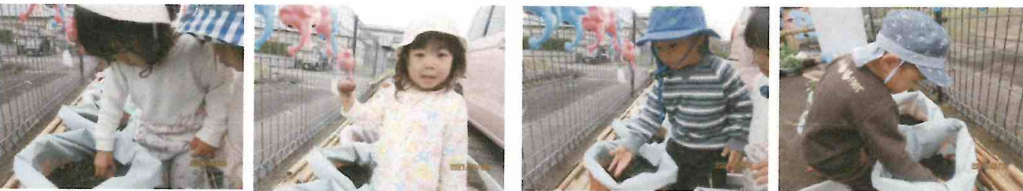
ジャガイモを植えました！