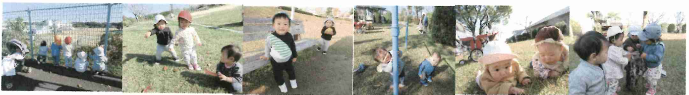
加納公園に行って遊んだよ！