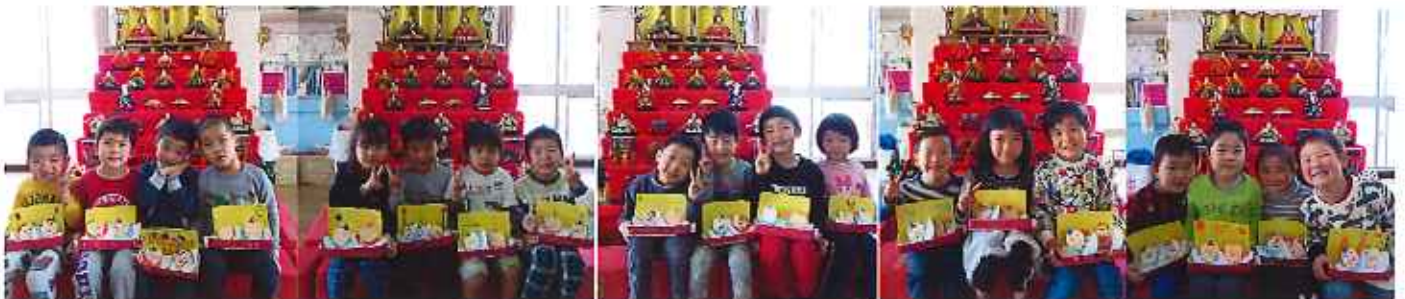
一年間で出来る事が少しずつ増えました。おうちの人からその度に“がんばったね”と褒められてうれしかったです！