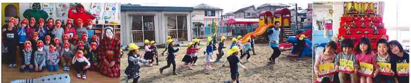
苦手なお野菜もしっかり食べられるようになりました 脱いだ衣服も上手にたためるようになりました！